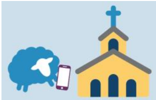
English OLM Survey

Nuestra Señora de las Montañas se encuentra actualizando los registros Parroquiales. Estamos pidiendo a las familias e individuos que se registren en la Parroquia a través de la siguiente encuesta. Si ya está registrado, le pedimos que verifique y actualice su información. Tenemos 1600 familias registradas, pero muchos correos electrónicos, cartas o llamadas telefónicas no se pueden entregar. La encuesta está en español e inglés. Su información no será vendida. Esto no aumentará la correspondencia del Clero, pero asegurará que la información que se entrega llegue realmente al destinatario. Si prefiere hacer esta copia impresa, visítenos en la oficina y la completaremos con usted. Gracias por su ayuda y participación.