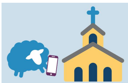
Spanish OLM Survey

Nuestra Señora de las Montañas se encuentra actualizando los registros Parroquiales. Estamos pidiendo a las familias e individuos que se registren en la Parroquia a través de la siguiente encuesta. Si ya está registrado, le pedimos que verifique y actualice su información. Tenemos 1600 familias registradas, pero muchos correos electrónicos, cartas o llamadas telefónicas no se pueden entregar. La encuesta está en español e inglés. Su información no será vendida. Esto no aumentará la correspondencia del Clero, pero asegurará que la información que se entrega llegue realmente al destinatario. Si prefiere hacer esta copia impresa, visítenos en la oficina y la completaremos con usted. Gracias por su ayuda y participación.